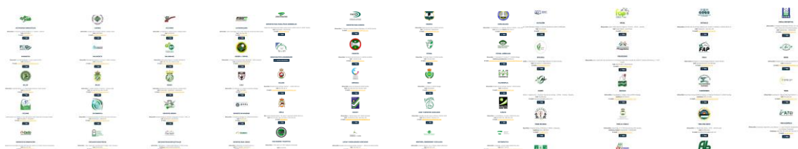
Ilustración 2. Red de Federaciones Deportivas Andaluzas

El objetivo de la Federación Andaluza de Deportes de invierno durante la temporada 2024/25 es seguir expandiendo su red de acuerdos con otras de las 59 Federaciones Andaluzas que puedan aportar valor al desarrollo del Deporte Adaptado de Invierno.