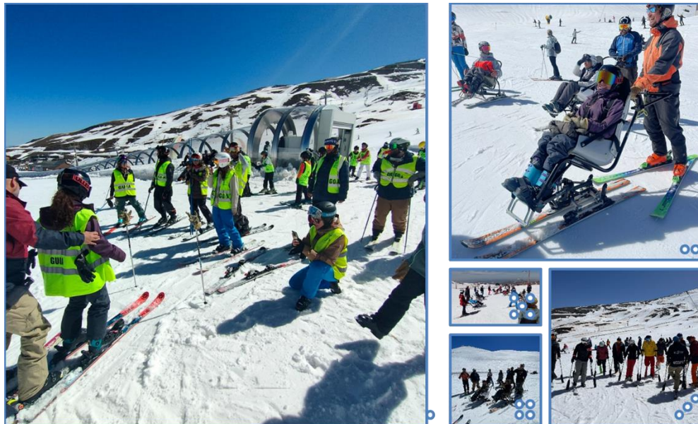
Ilustración 5. Algunas imágenes del desarrollo del curso

25 horas teóricas en aula: Estas sesiones se dedicaron a la instrucción teórica sobre temas relevantes, como técnicas de enseñanza, seguridad y diversidad funcional.