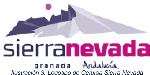
Ilustración 3. Logotipo de Cetursa Sierra Nevada