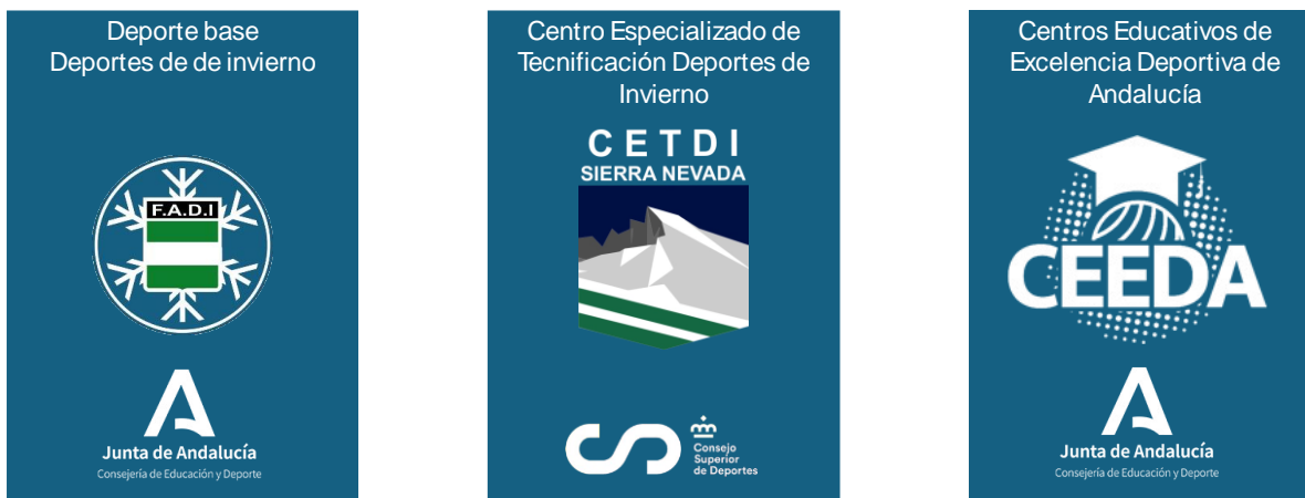
Ilustración 6. Pilares de los programas deportivos FADI

La Federación Andaluza de Deportes de Invierno ha incluido en la documentación justificativa de los programas del Centro Especializado de Tecnificación Deportiva de Sierra Nevada (CETDI) en la Modalidad de Esquí Alpino a deportistas con Discapacidad visual. Dichos deportistas también están incluidos en los programas de seguimiento de la Real Federación Española de Deportes de Invierno.